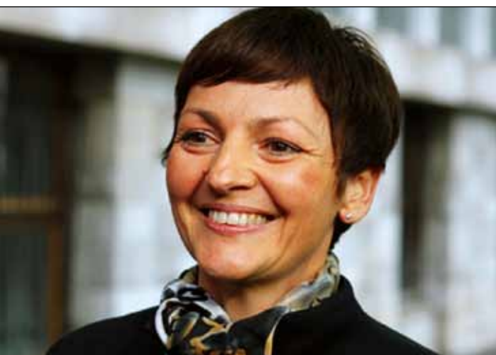
DR. MAJA MAKOVEC BRENČIČ MINISTRICA ZA IZOBRAŽEVANJE, ZNANOST IN ŠPORT

Spoštovani športni pedagogi, delavci na področju športa ter vsi ljubitelji športa,