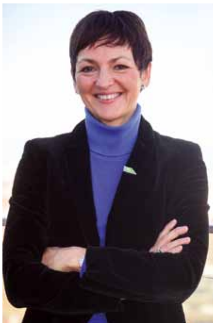
DR. MAJA MAKOVEC BRENČIČ

MINISTRICA ZA IZOBRAŽEVANJE, ZNANOST IN ŠPORT